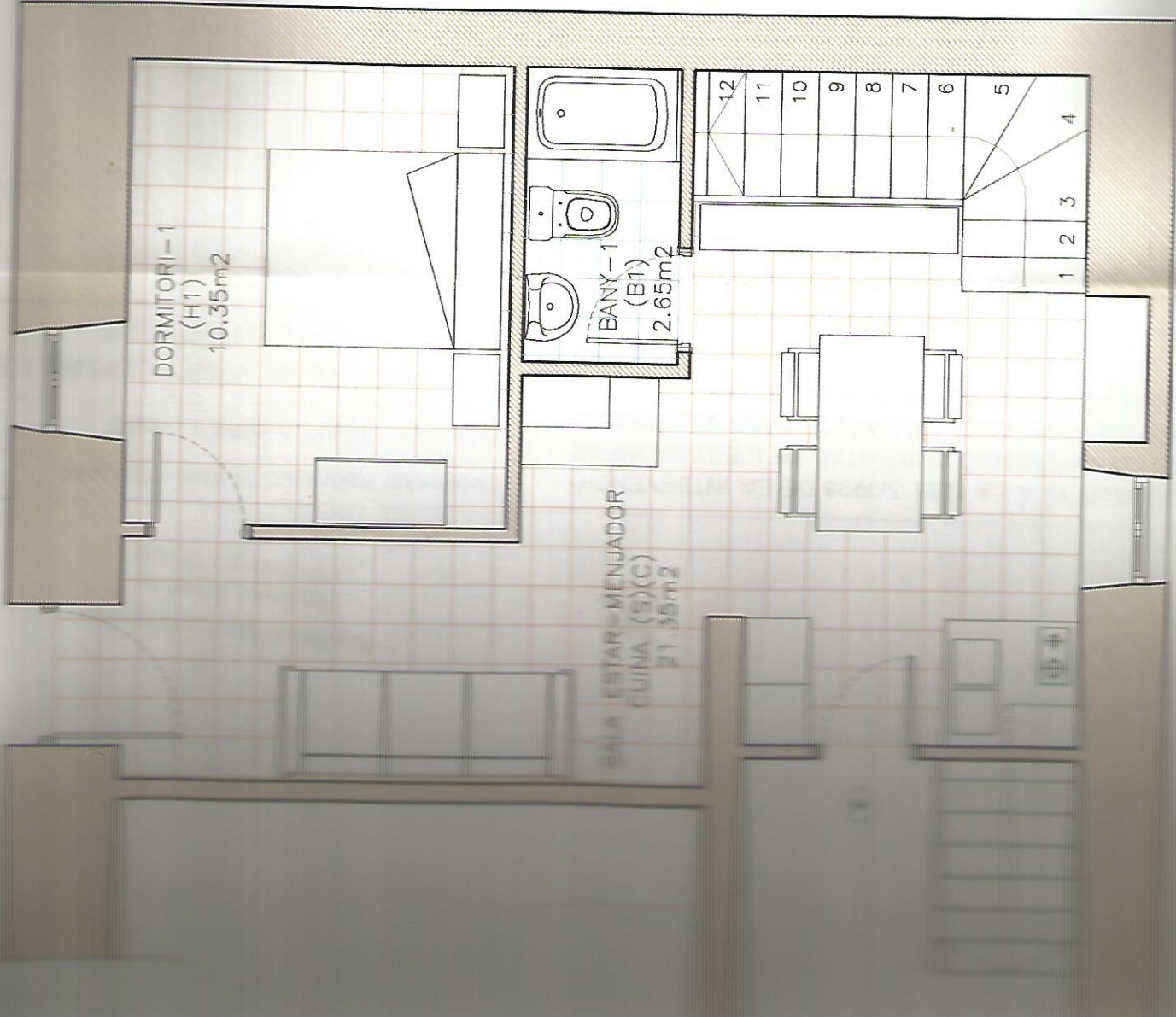
GRANER DE VII ARRASA" DISTRIBUCIÓ I SUPERFÍCIES